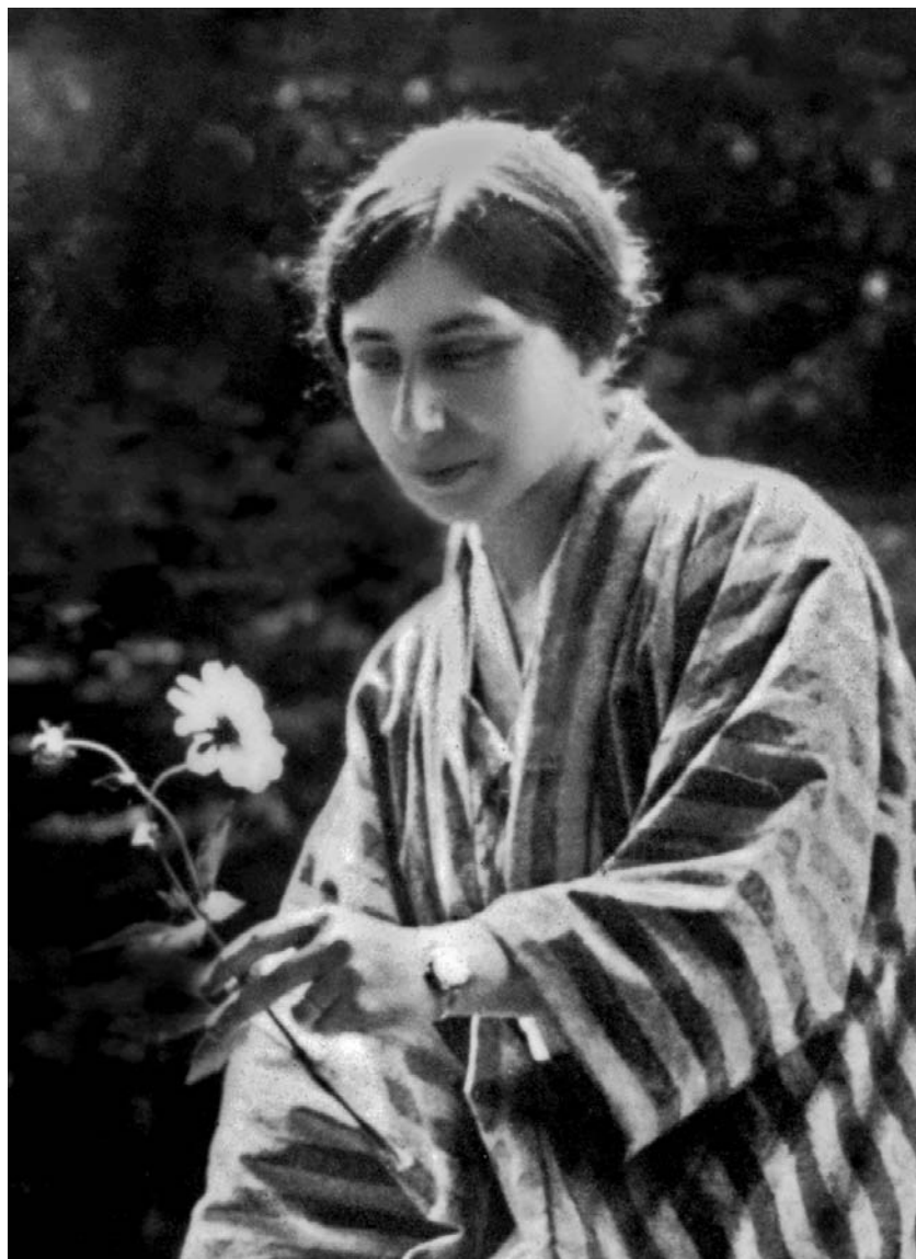
La Mère à Tokyo en 1916