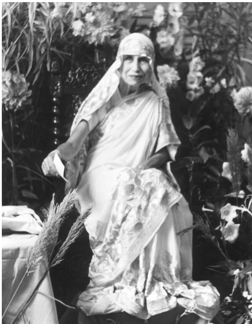
La Mère en 1954