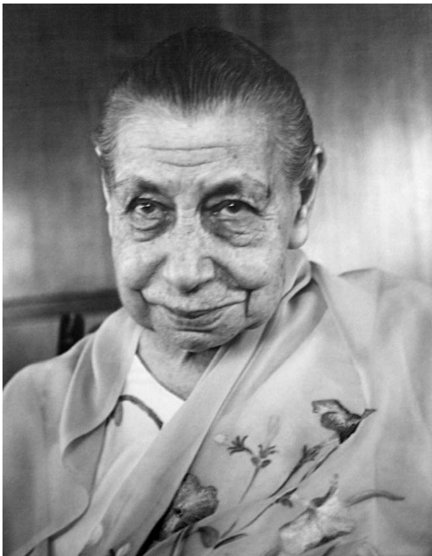
La Mère en 1969